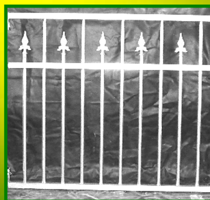
mit Spitzen nach Wahl